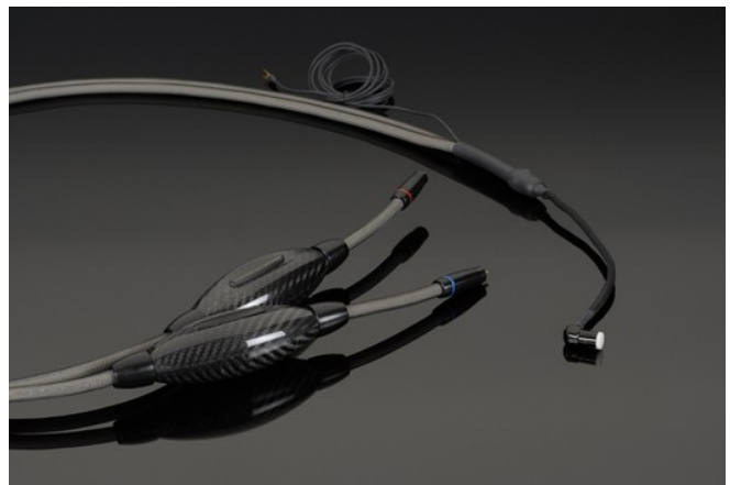
OPUS PHONO CABLE(特注)