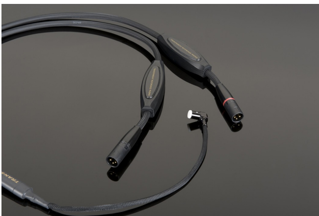
REFERENCE PHONO CABLE

こうした優れた技術を基に精巧な組み立て工程を経て製造されるトランスペアレント・フォノケーブルは、その極めて高いノイズ低減効果と非共振効果によって、微細音のより深い再現力と楽音の精確な時間的・空間的表現力を実現し、ダイナミクスとエネルギーを余すところなく伝送する高い能力を獲得しています。